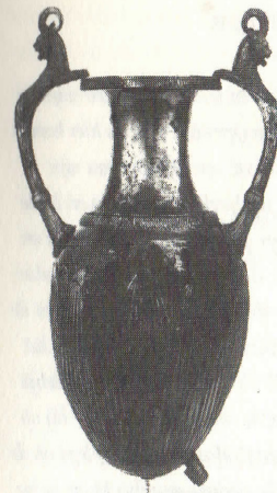
Wijnkruiik, zilver met verguldsel uit het Perzische rijk (dat kort daarop door Alexander de Grote werd veroverd).

Het kookboek van Apicius (zie hoofdstuk 8), dat dateert uit omstreeks 400 na Christus, geniet grote bekendheid. Dit is een van de eenvoudigste recepten; de overdaad aan kruiden of specerijen waar de meeste van Apicius' recepten bol van staan, ontbreekt hier. Het had in vrijwel iedere huishouding in de oudheid bereid kunnen worden. Het