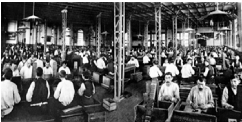
000000 Boschveldweg, Sigarenfabriek Eugène Goulmy en Baar. Ca 1900

Het rijksmonument is met zijn boogramen, kruisramen en een achzijdige traptoren een heel bijzonder pand. Voor de constructie van het gebouw werd ijzer gebruikt en het is opgetrokken uit schoon mestelwerk. Het is een voor die tijd zeer modern gebouw met veel voorzieningen zoals een lift, airco, sanitair en vloerverwarming. In de kelder van de fabriek stonden de ketels van de centrale verwarming en daar bevonden zich ook de kolenbergplaatsen. Op de begane grond waren de kantoren, de kleedkamer voor de sigarenmakers, magazijnen en de woning van de conciërge. In de werkzaal op de eerste etage oefenden ca. 500 sigarenmakers hun vak uit. Op deze verdieping waren ook de perskamer en de magazijnen voor natte sigaren en afval gesitueerd. De tweede verdieping omvatte de expeditiezaal, de sorteerderij, droogkamers en magazijnen voor het laatste verwerkingsproces.