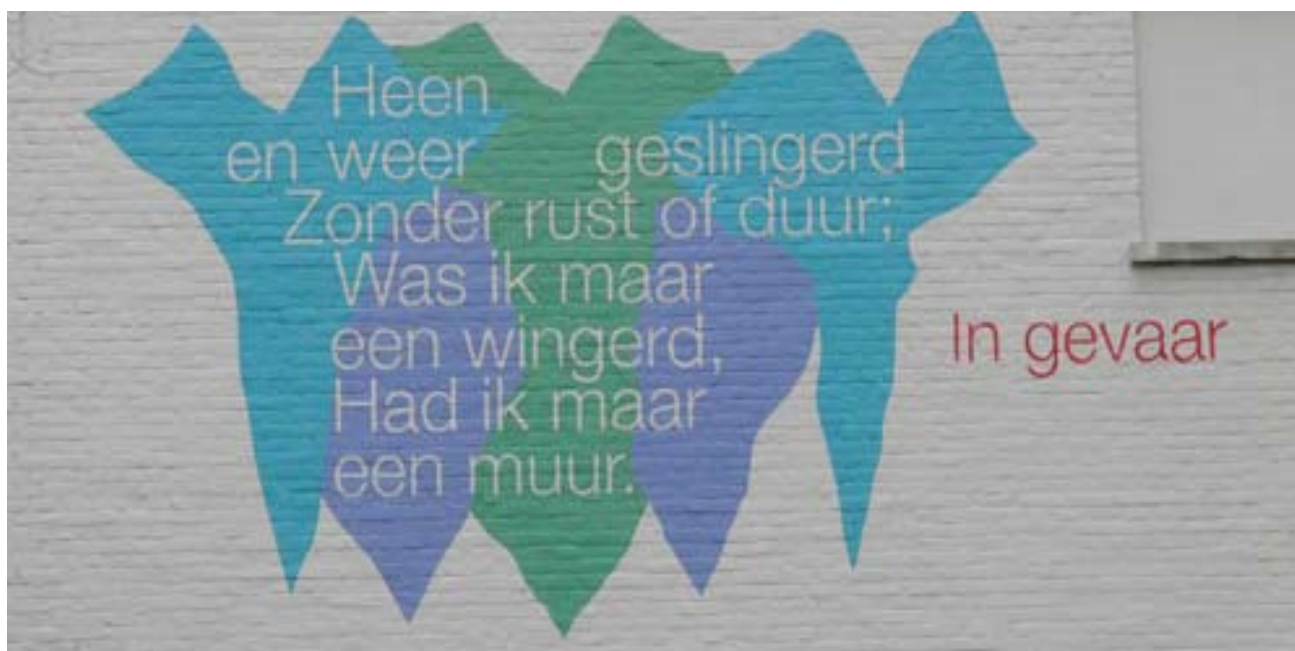
Adriaan Roland Holst (1888-1976)

Gouden Middeleeuwen vertelt hoe 1500 jaar geleden het leven was in onze streken en welke rol Nederland speelde in de wereldwijde handelsnetwerken van het vroegmiddeleeuwse Europa. Ontdek dat de Vroege Middeleeuwen geen 'Dark Ages' waren maar, juist gouden tijden.